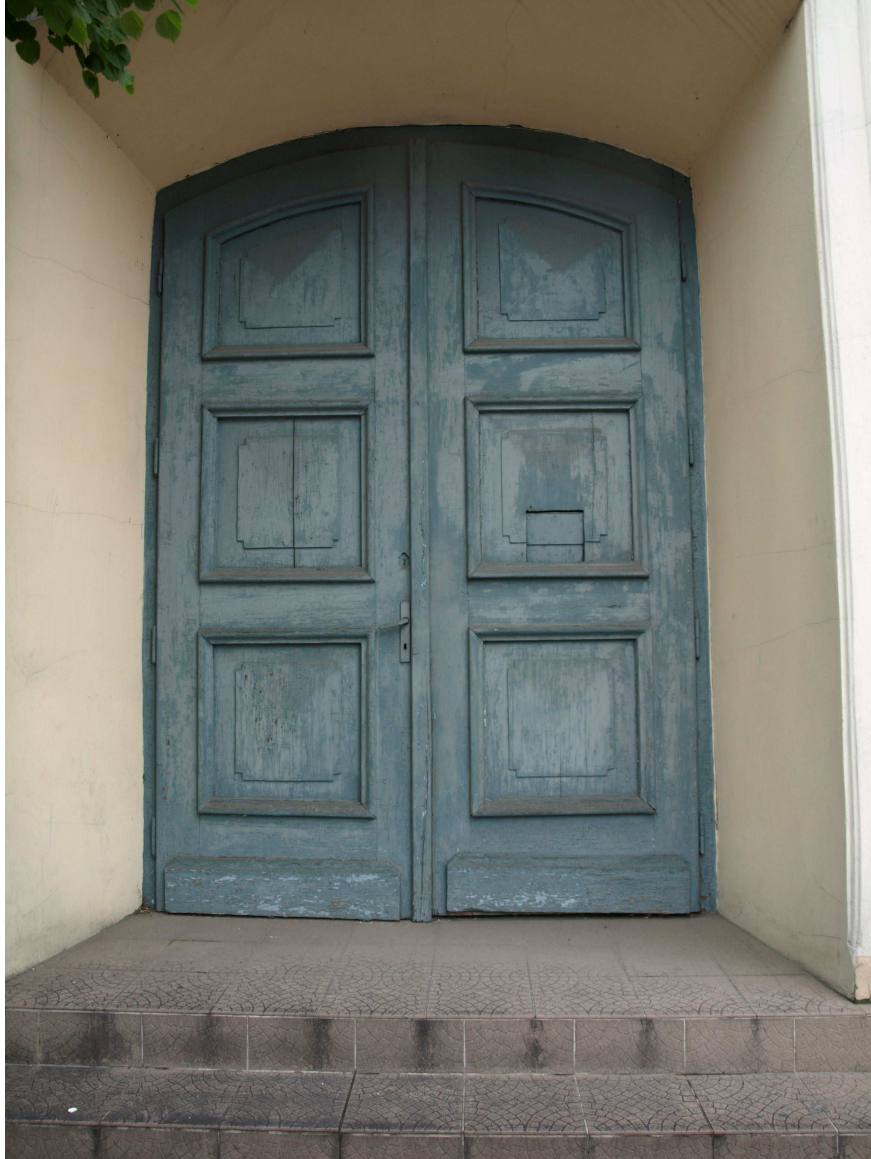
STAN ISTNIEJĄCY- do renowacji