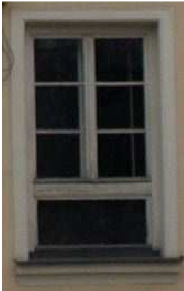
STAN ISTNIEJĄCY -PARTER