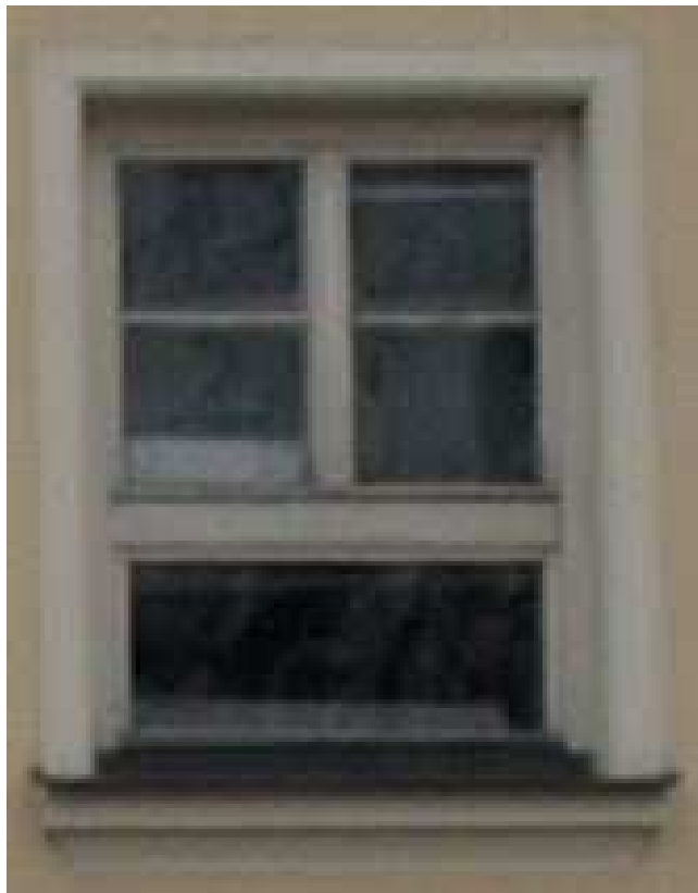
STAN ISTNIEJĄCY -1,2 PIĘTRO