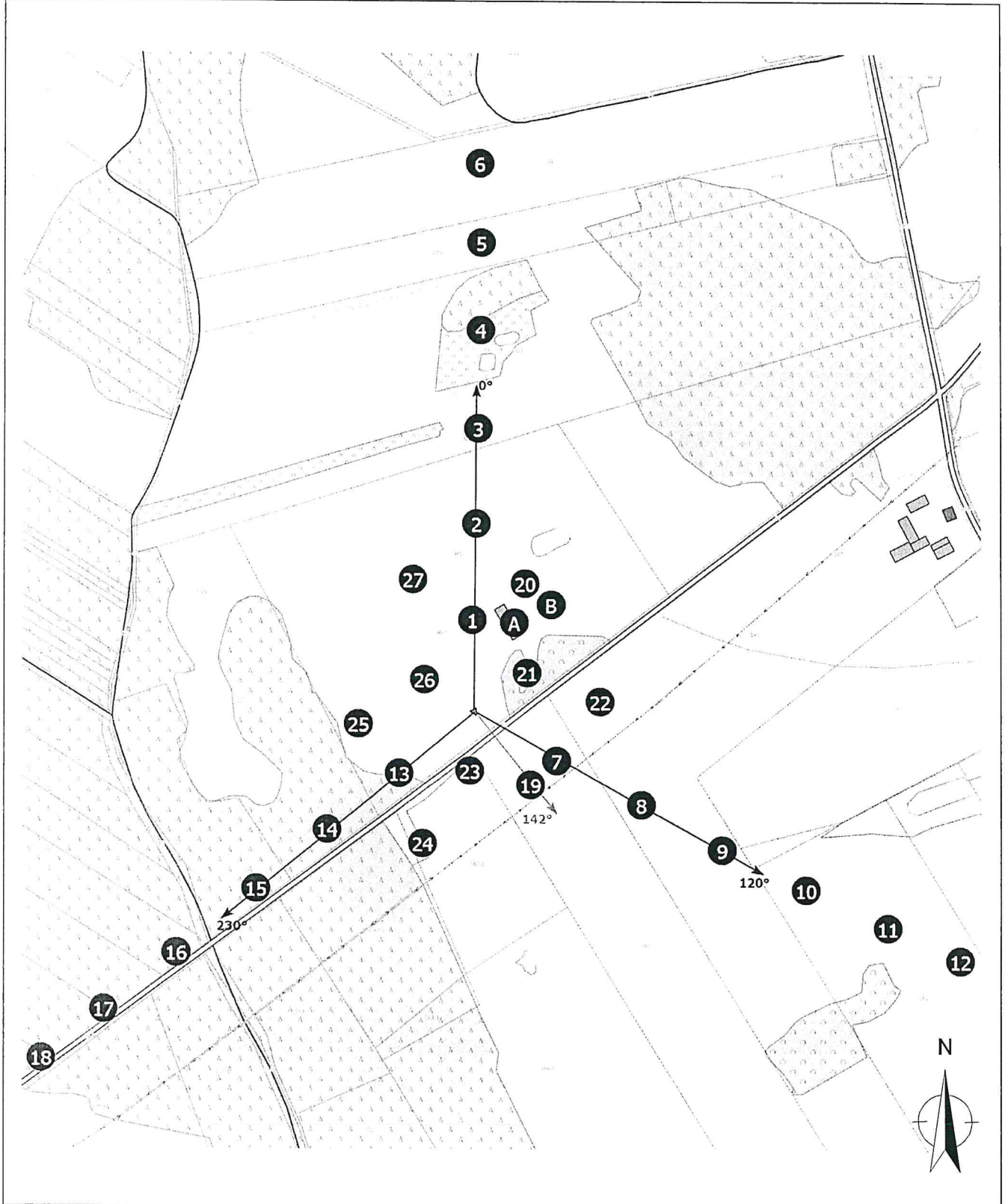
Załącznik 2. Widok pionów pomiarowych