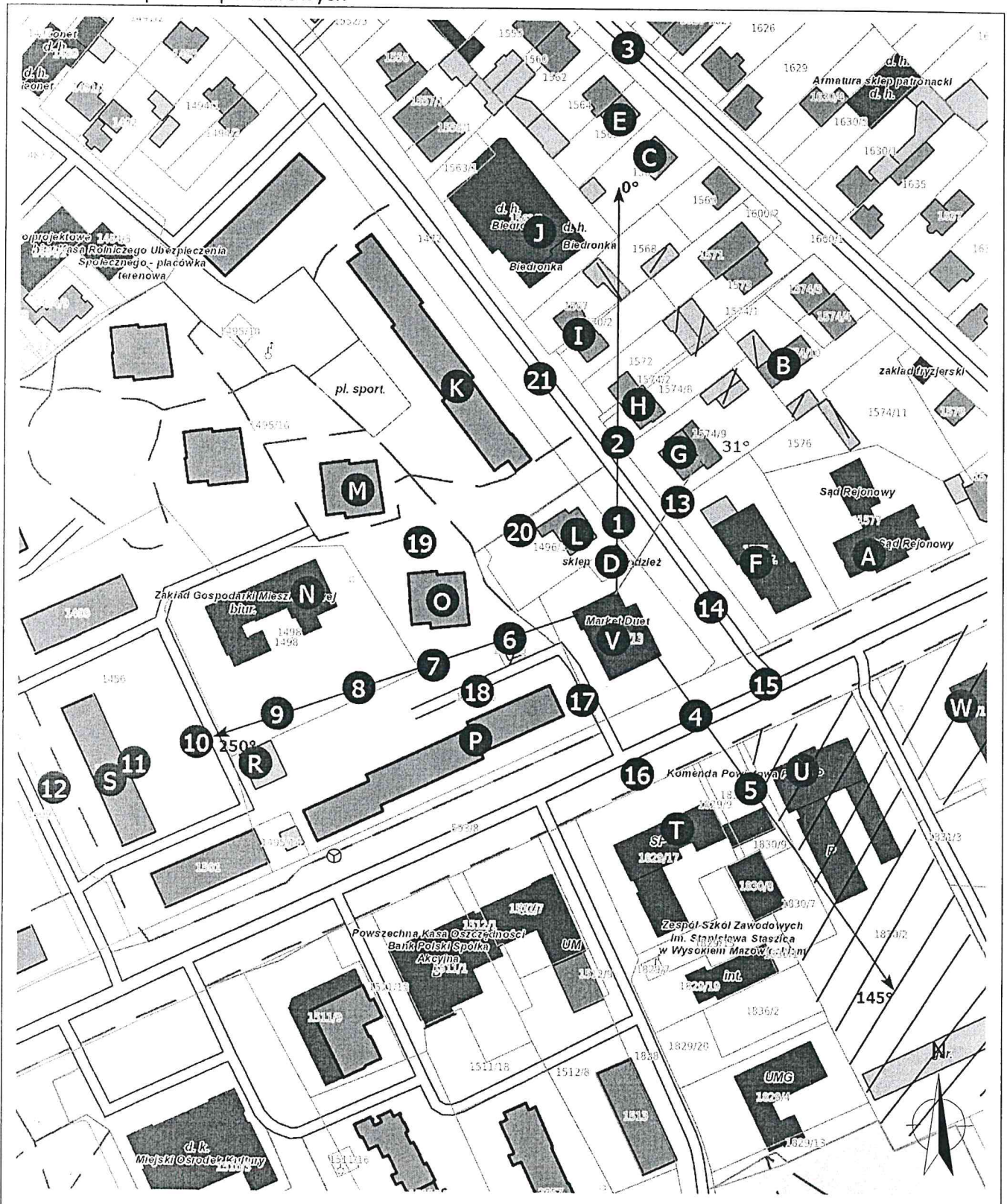
Załącznik 2. Widok pionów pomiarowych